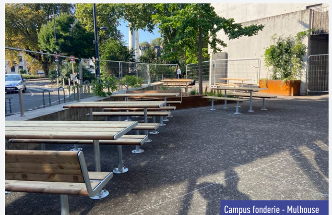
Campus fonderie - Mulhouse

De plus, afin de promouvoir l'usage du vélo auprès des étudiants, un local pour stationner une vingtaine de vélos a été construit entre le bâtiment Accueil et le Restaurant universitaire.