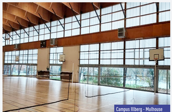
Campus Illberg - Mulhouse

Sur le campus Illberg, ce sont les panneaux de basket qui ont été changés et mis aux normes au Gymnase Universitaire dans le cadre du projet CVEC. Il a ainsi été installé des nouveaux panneaux de basket relevables en charpente avec commandes électriques et des nouveaux panneaux de basket rabattables manuellement.